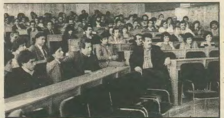
Από την Παγκύπρια Γενική Συνέλευση των υπαλλήλων της Εθνικής που έγινε στις 29/3 στην οποία αποφασίστηκε η κήρυξη απεργίας για την Παρασκευή 13/4.

Οι υπαλλήλοι των τραπεζών προσπαθούν να παλέψουν για την επίλυση των προβλημά-